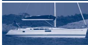
Sun Odyssey 49i