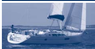
Sun Odyssey 44i