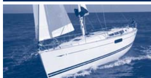
Sun Odyssey 44i Performance