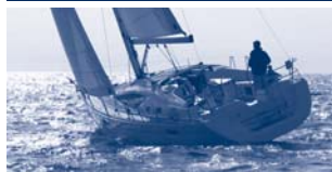
Sun Odyssey 39 DS Performance