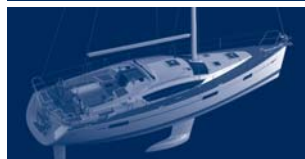
Sun Odyssey 42 DS