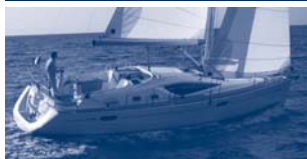
Sun Odyssey 39 DS